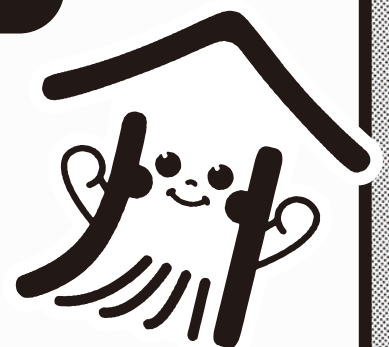
熟年相談室イメージキャラクター 「い〜かいごくん」